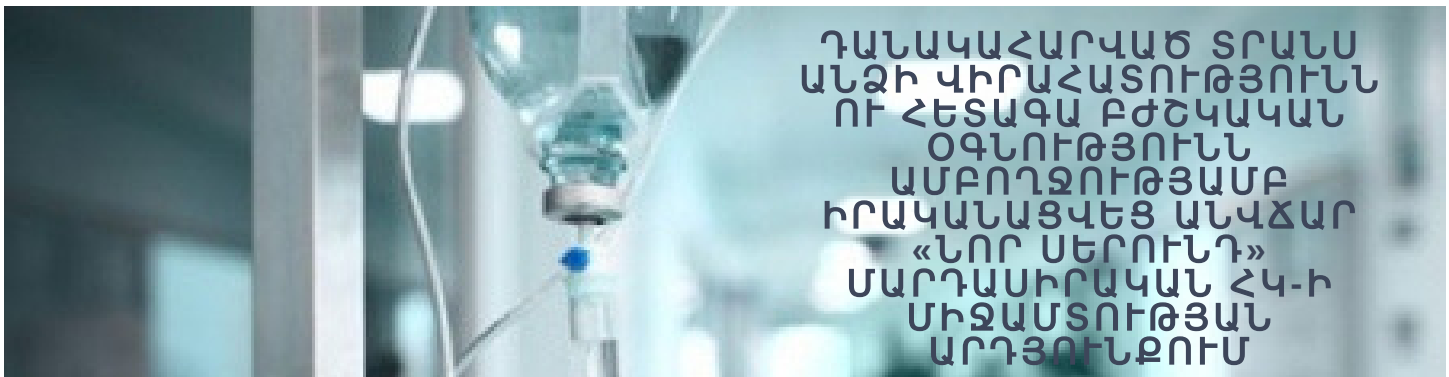
Դանակահարված տրանս անծի վիրահատությունն ու հետագա բժշկական օգնությունն ամբողջությամբ իրականացվեց անվճար «Նոր Սերունդ» Մարդասիրական ՀԿ-ի միջամտության արդյունքում

2018թ.-ի ապրիլի 15-ին երեկոյան ժամը 02:30-ի սահմանում իր վարձակալած բնակարանում դանակահարվել է տրանս* անձ XX-ը: Վերջինս համացանցի միջոցով ծանոթացած տղամարդու հետ ձեռք է բերել հանդիպման պայմանավորվածություն: Անձանոթ անձը չարաշահելով XX-ի վստահությունը, մուտք է գործել նրա բնակարան, սրճել, զրուցել: Այնուհետև, երբ տուժող XX-ը շրջվել է թիկունքով դեպի անձանոթը, վերջինս քաշել է XX-ի մազերից և դանակով հարվածել պարանոցին: Դանակը մխրճվել է XX-ի կոկորդը: Անձանոթ անձը հեռացել է տանից, իր հետ վերցնելով Տուժողի հեռախոսը (iphone 7), mitsubishi մակնիշի ավտոմեքենայի բանալիները և տղամարդու բաճկոնը: Տուժող XX-ը դանակահարող անձի հեռանալուց հետո, գրեթե ուժասպառ վիճակում, հանել է դանակը կոկորդից և սողալով հասել մինչև հարևանի դուռը: Հարևանները շտապ արձագանքել են, զանգահարել Շտապ օգնության ծառայություն և օգնել վիրավորին մինչև բժիշկների մոտենալը: XX-ը տեղափոխվել է Էրեբունի բժշկական կենտրոնի վերակենդանացման բաժանմունք, որտեղ էլ առավոտյան ժամը 06:20-ի սահմանում ենթարկվել է վիրահատության: