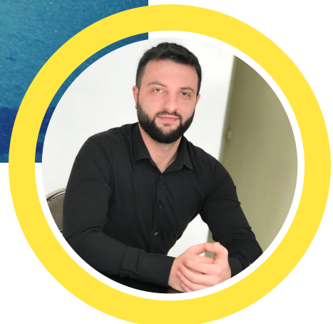
ԱՎԵԼԻ ԱՆՎԱԽ ԵՆՔ

Մասսայական անհնազանդության խաղաղ ցույցերը հանգեցրին հնացած ու կոռումպացված ռեժիմի փլուզմանը: Այն կոչվեց Թավշյա հեղափոխություն, քանի որ մարդիկ ժողովրդավարության անսխաղեպ հաղթանակի հասան առանց որևէ կրակոցի: Անհնազանդության գործողությունները փոքրամասնությունների համար պատմական ու շրջադարձային կետ դարձան: