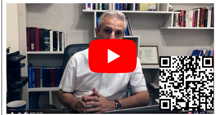
Խոշտանգումներից զերծ մնալու իրավունք ուստիկանության համակարգում