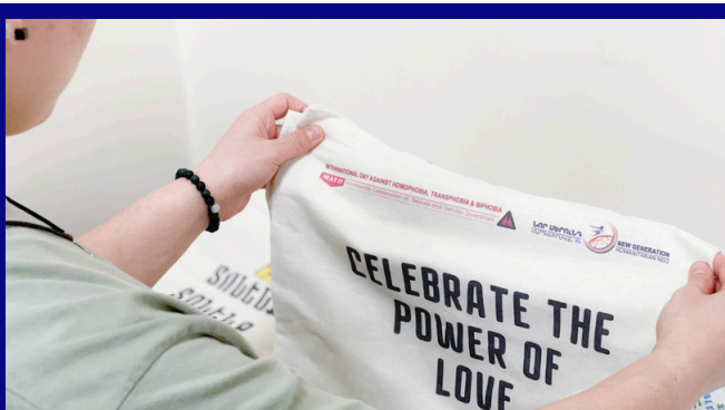
IDAHOBIT-2021 «ՀԻՄՆԱՆՆԴԻՐՆԵՐԸ, ԱՌԱՋՆԹԱՅՆ ԵՎ ՀՆԱՐԱՎՈՐՈՒԹՅՈՒՆՆԵՐԸ»

Վերաքննիչ դատարանի կողմից 2021թ-ի մարտի 26-ին փաստաբանի կողմից ներկայացված բողոքը ընդունվել է վարույթ: