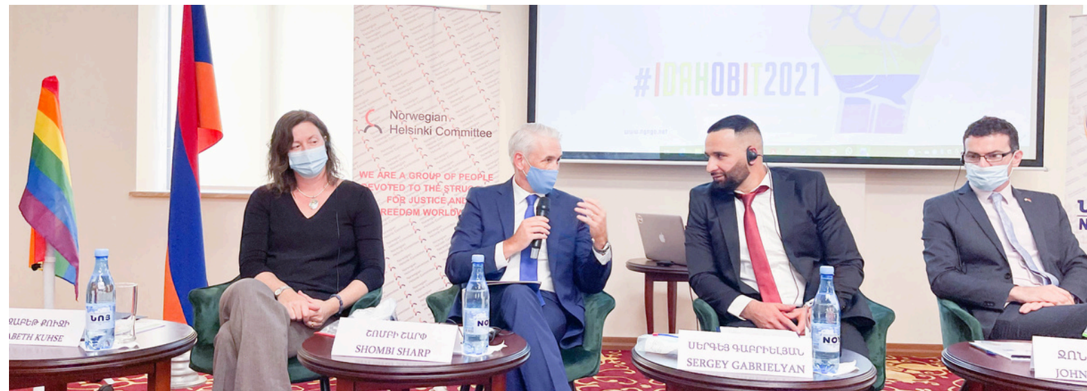
Հոմոֆոբիայի, բիֆոբիայի և տրանսֆոբիայի դեմ պայքարի միջազգային օր

Ամեն տարի մայիսի 17-ն աշխարհում նշվում է որպես հոմոֆոբիայի, բիֆոբիայի և տրանսֆոբիայի դեմ պայքարի միջազգային օր: 1990թ.-ի մայիսի 17-ին Լույնաստեռականությունը հանվեց ԱՀԿ հիվանդությունների միջազգային դասակարգչի հոգեկան խանգարումների ցանկից: